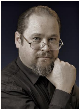
Franz Kaslatte Autor

Bringen Sie Ihren Kindern erfolgreich mit EasyGrimm die faszinierende Welt der Grimm'schen Märchen näher und unterstützen Sie nebenbei ihre Deutschkompetenz. Helfen Sie mit , auf breiter Basis die Deutschförderung zum Gelingen zu bringen, nutzen Sie EasyGrimm und sagen Sie es weiter!